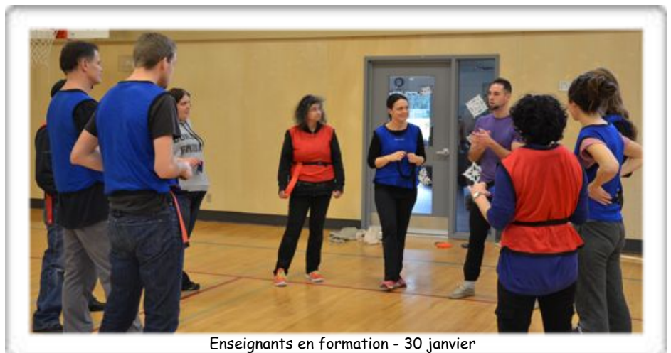
Enseignants en formation - 30 janvier