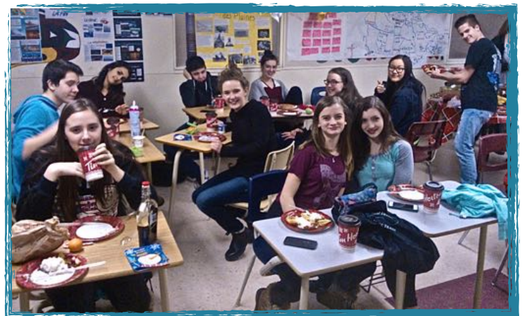
Déjeuner de Noël à Carihi