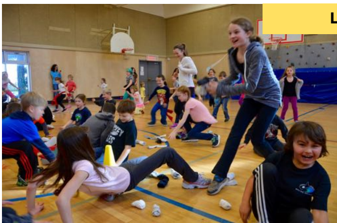
La traditionnelle bataille de boules de bas.

4 avril - Retour du congé du printemps 5 avril - Pièce de théâtre - Mathieu Mathématiques Semaine du 11 avril - Concours d'art oratoire 28 et 29 avril - Congé pour les élèves