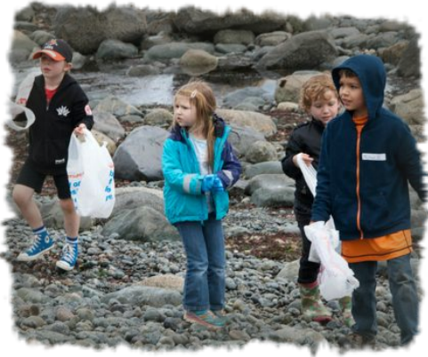
Nettoyage des berges 1er mai 2015

Vous recevrez le bulletin intérimaire de votre enfant le jeudi 14 mai.